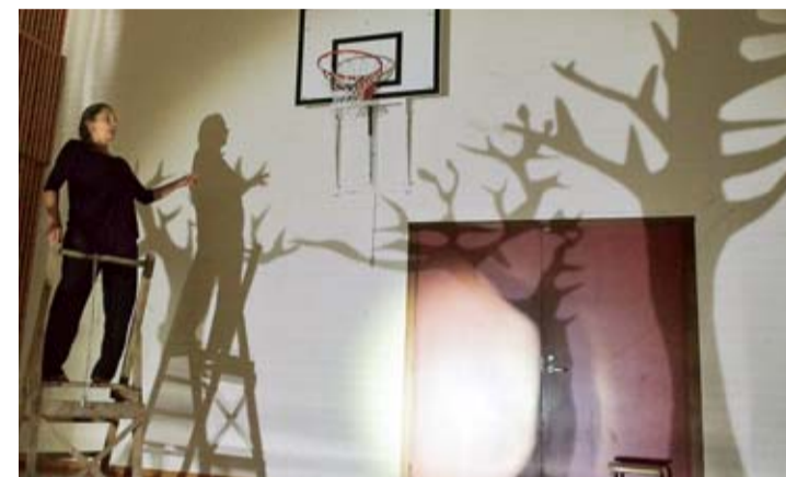
LIVLIG Grete Sneltvedt rör sig runt runt i salen.